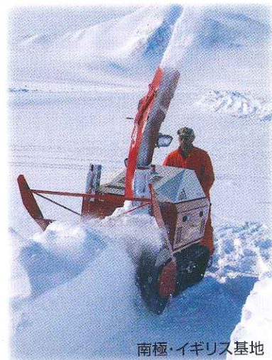
南極・イギリス基地