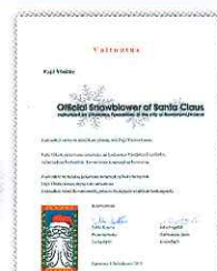
サンタクロース公認除雪機認定書