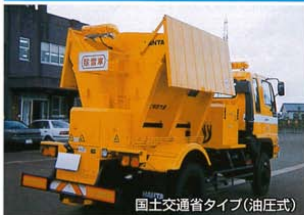
国土交通省タイプ(油圧式)