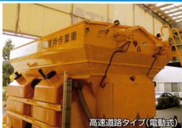
高速道路タイプ(電動式)

ホッパーカバーの開閉は標準仕様では人力開閉となりますが、自動開閉装置を付けるとキャブ内からの遠隔操作で開閉する事ができ、効率的な作業ができます。