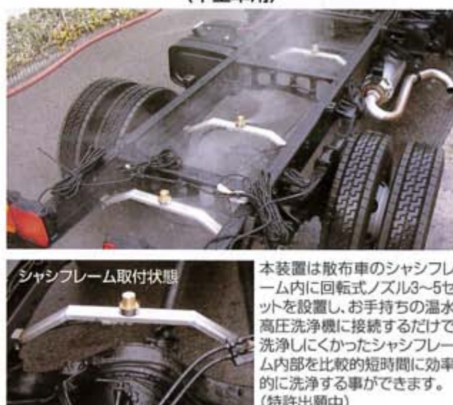
シャシフレーム取付状態

本装置は散布車のシャシフレーム内に回転式ノズル3~5セットを設置し、お手持ちの温水高圧洗浄機に接続するだけで、洗浄しにくかったシャシフレーム内部を比較的短時間に効率的に洗浄する事ができます。(特許出願中)